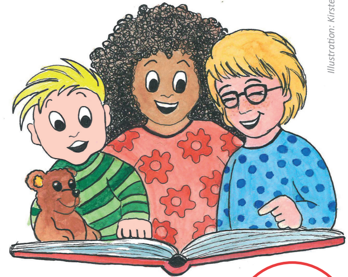
Illustration: Kirsten Andres